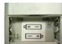
電池の方向を表示に合わせて入れてください

本体を操作したい機器と操作する場所の間に設置してください。壁等に取り付ける場合は、付属の取り付けアダプタを使用してください。